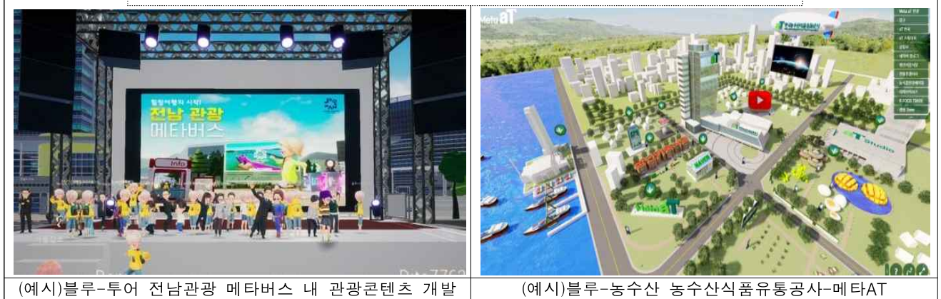
(예시)블루-투어 전남관광 메타버스 내 관광콘텐츠 개발